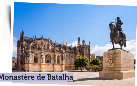
Monastère de Batalha

► Fatima ► Batalha ► Nazaré ► Alcobaca ► Fatima