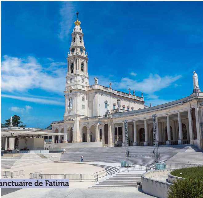
Sanctuaire de Fatima